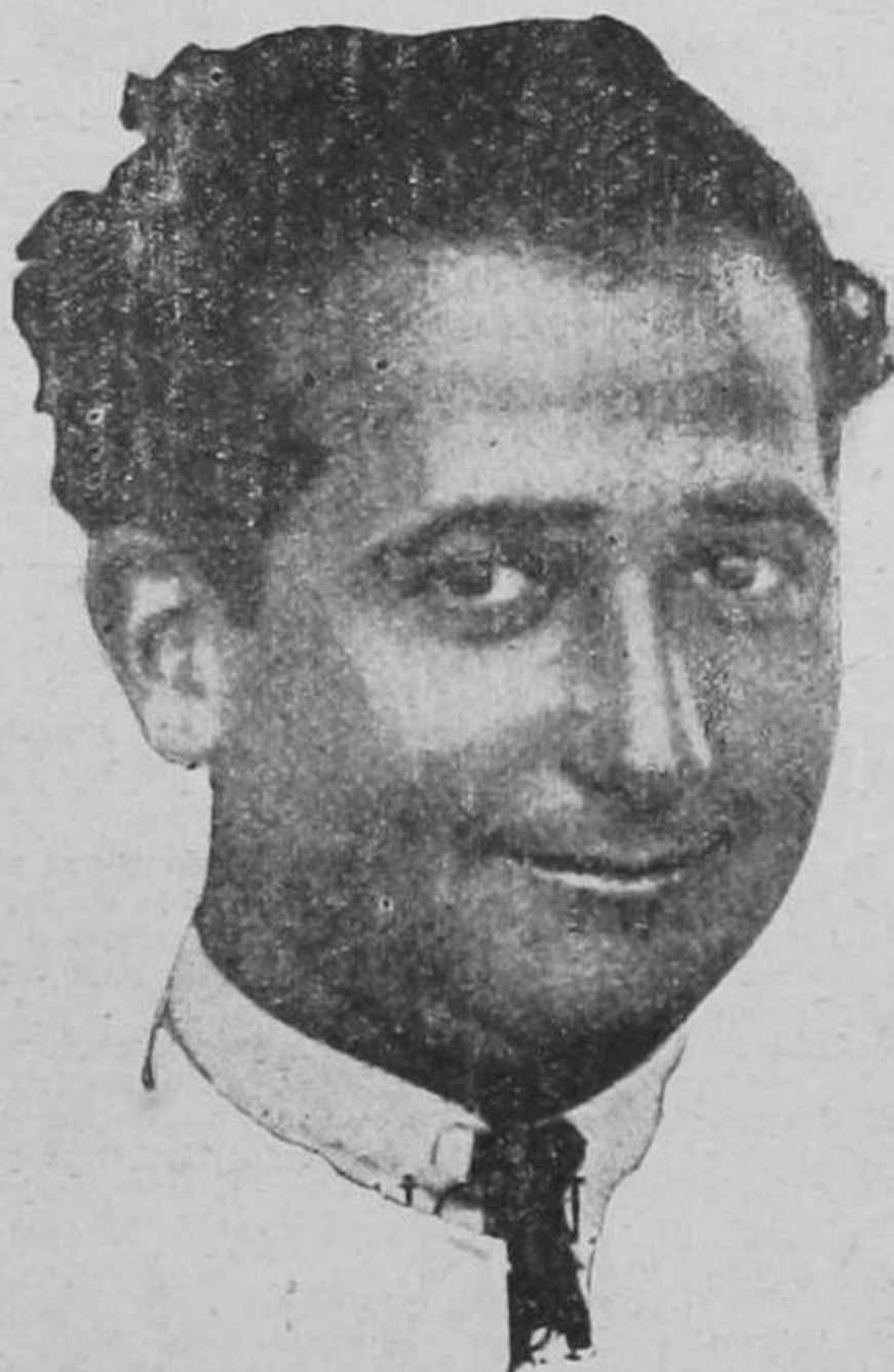
Coronel RAMON FRANCO

BURGOS, 19 — UP.—FLASH El coronel Ramón Franco, hermano del generalísimo y jefe